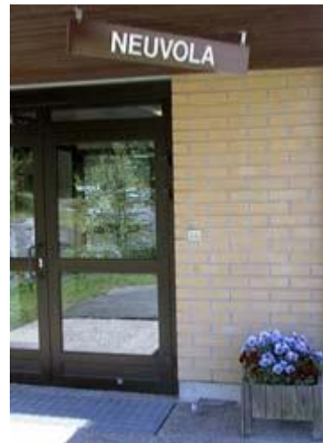
Lapsiperhetiimi yhteistyön muotona

Palvelujen järjestämisvelvoite perustuu kansanterveyslakiin ja -asetukseen.