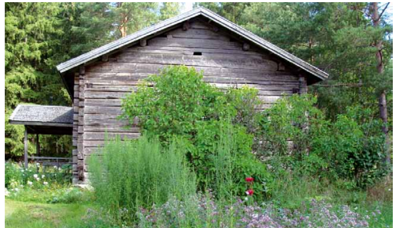
Narvan museo ja perinneperit.

Toimivat tietoliikenneyhteydet ovat välttämättömyys yrittäjille ja usein osallistumisen ehto myös asukkaille. Yhteyksien mahdollistaminen vähentää asuinpaikasta johtuvaa eriarvoistumista ja tuo turvallisuutta. Tulevaisuudessa ”Mummo-ohjelmat” mahdollistavat myös vanhuksien teknologian hyödyntämisen ja asioinnin helpottamisen. Vesilahdessa laajakaistahanke tuo toteutuessaankäytännössä koko kunnan asukkaille yhteydet. Lempäälässä on yksittäisillä hankkeilla edistettävä yhteyksien syntymistä.